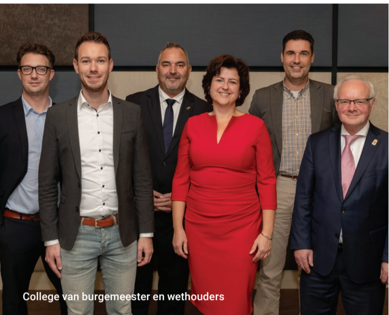
College van burgemeester en wethouders